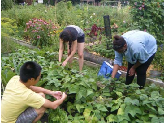
Employés d'été au jardin